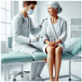
Prik in uw knie