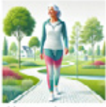
Uw manier van leven veranderen