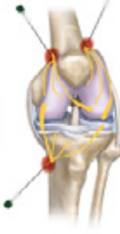
Behandeling op de pijnpoli