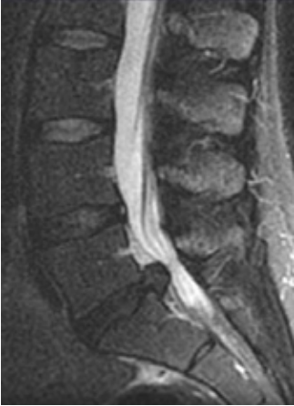
Figuur 3. MRI van de onderrug met een hernia