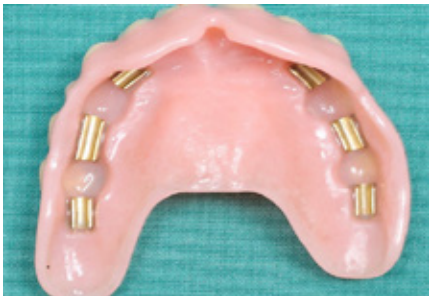
Figuur 5: klikgebit met hulzen die op de staafjes van de implantaten worden vastgeklikt

Voor het vastzetten van het klikgebit in de bovenkaak, worden meestal vier tot zes implantaten geplaatst. Dit is nodig omdat de botkwaliteit in de bovenkaak minder goed is dan in de onderkaak. Met meer implantaten worden de kauwkrachten beter over de bovenkaak verdeeld.