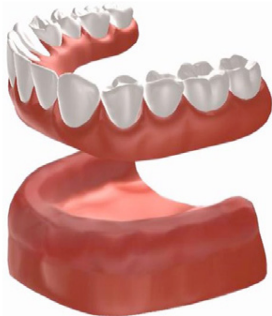
Figuur 1: traditionele prothese

Een klikgebit op implantaten kan een oplossing zijn voor deze klachten.