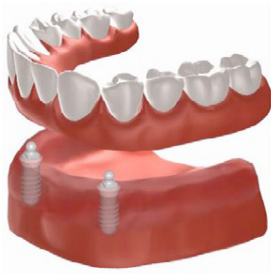
Figuur 2: klikgebit voor de onderkaak op twee implantaten

Door het kliksysteem zit de prothese stevig vast in de mond. U hoeft geen kleefpasta (meer) te gebruiken en u kunt zonder problemen eten, lachen en praten. De prothese is goed in en uit de mond te nemen om schoon te maken. Implantaten bevorderen bovendien het behoud van het kaakbot.