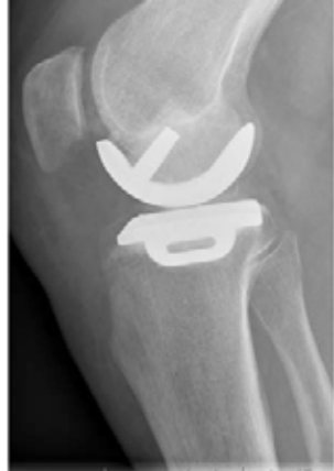
Zijaanzicht hemi knieprothes