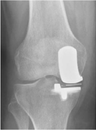
Vooranzicht hemi knieprothese

Na de operatie wordt er ter controle een röntgenfoto gemaakt.