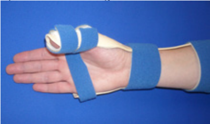
Dag- en nachtstand van de hand in de spalk

De hechtingen zijn meestal oplosbaar en zullen binnen 3 weken verdwijnen. Niet oplosbare hechtingen worden na 2 weken verwijderd.