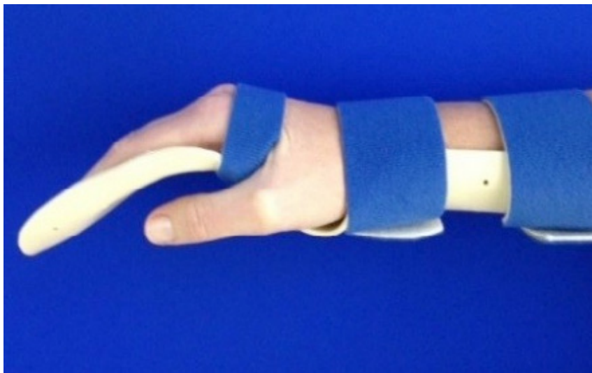
Dag- en nachtstand van de hand in de spalk

Tijdens de eerste 6 weken na de operatie moet u elk uur in de spalk oefenen volgens instructie van de therapeut. Aan het einde van deze periode mag u afhankelijk van het herstel de aangedane hand gaan inzetten bij lichte dagelijkse activiteiten.