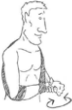
verf roeren met 2 handen