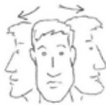
draaien van het hoofd

Mocht u in aanmerking komen voor het Schouderherstelplan, lees dan onderstaande informatie zorgvuldig door!