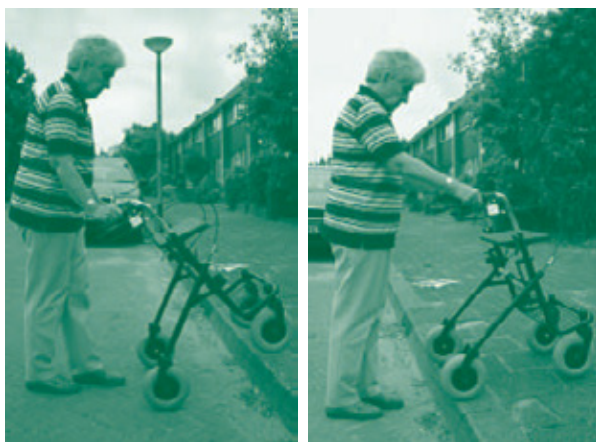
Stap 4 en 5 Stap 6 en 7

Als u de stoep af loopt, kunt u eerst de rollator van de stoep afzetten vervolgens de remmen inknijpen en bijstappen.