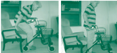
Stap 5 Stap 6