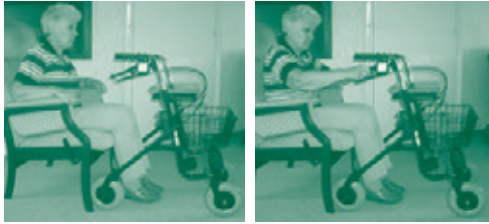
Stap 2 en 3 Stap 4