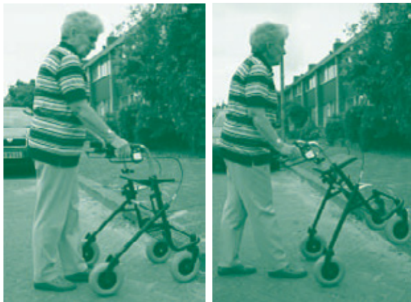
Stap 1 en 2 Stap 3