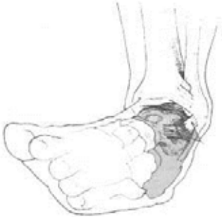
Verzwikking van de enkel

Deze folder gaat alleen over het verrekken of verscheuren van de banden en het kapsel van de enkel.